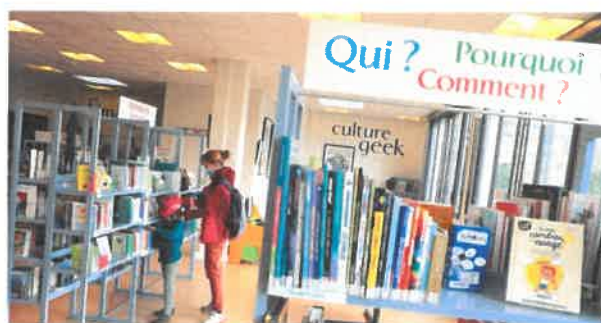
LA MÉDIATHÈQUE DU PERREUX-SUR-MARNE. - PHOTO OLIVIER DION

Quels ouvrages ont été les plus empruntés en bibliothèque publique ? Et acquis ? Quels auteurs ? Quelle part de BD, de jeunesse, de